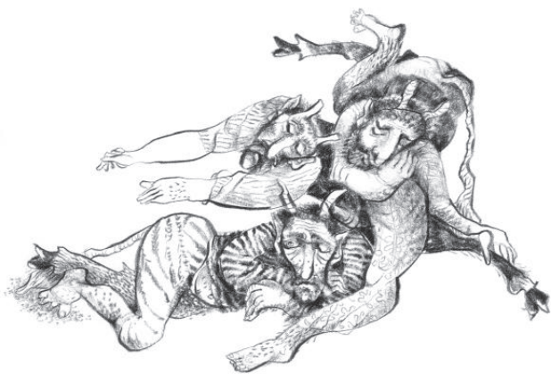
Ilustrace Ludmila Vašková