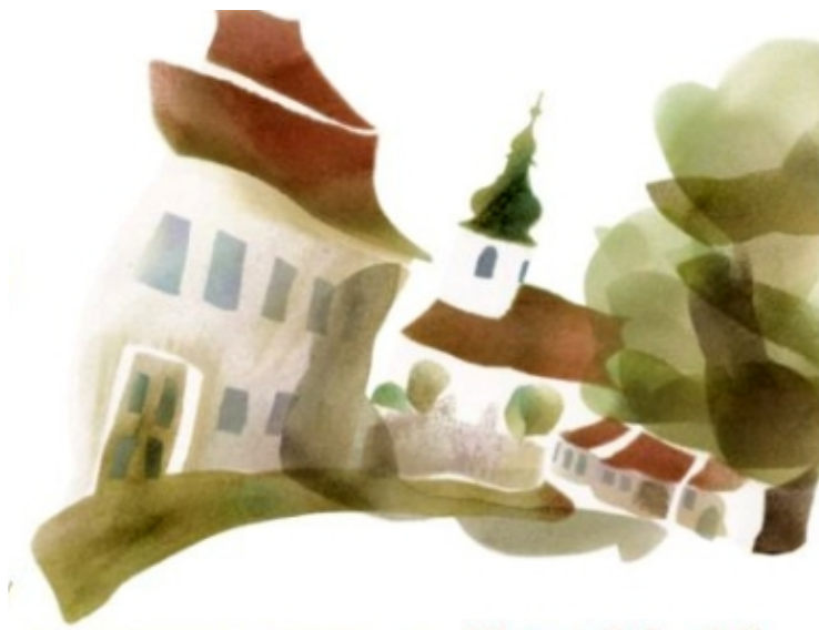
kresba: Petra Jiroušková

...a hlavně nezapomeňte s sebou vzít také své děti.