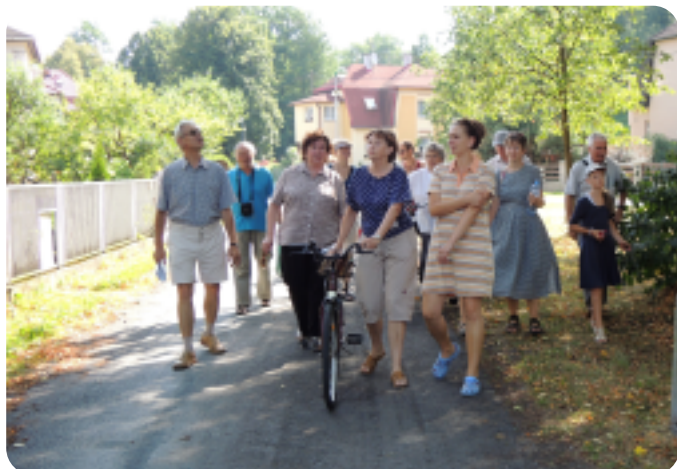
Letní procházky 2013

Vzpomínání na historii města s tvůrčí skupinou seniorů scházející se pod hlavičkou projektu knihovny „Město v mé paměti“.