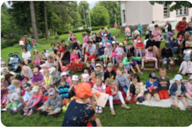
Pondělí 2. až pátek 6. června, 17.00 hod. VEČERNÍČKY S MUZIKOU