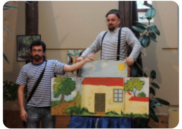
Pátek 6. června, 17.00 hod. DIVADLO TILIA