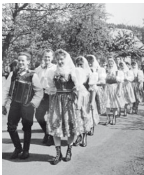
Průvod ke kácení máje