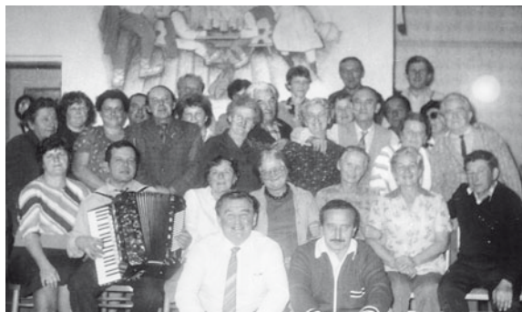
Fota ze setkání herců na Kamenci

Zažil jsem i mnoho divadelních představení na profesionální úrovni ve Zlíně, Ostravě, Novém Jičíně i v Praze. Byly to krásné zážitky.