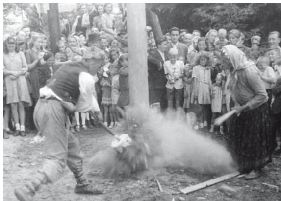
Scénky z kácení máje