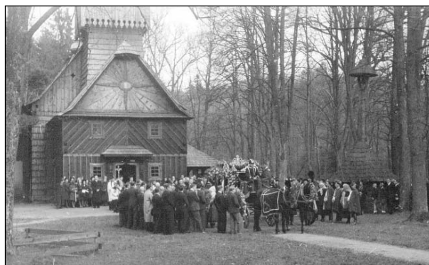
Rozloučení ve Valašském muzeu v přírodě.