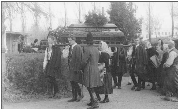
Smuteční průvod na rožnovském hřbitově.