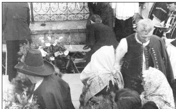
Uložení do hrobu.